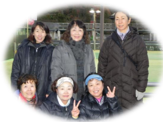
2013年度 シニアの部 優勝チーム「しばてん」(高知県)