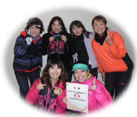
2013年度 一般の部 優勝チーム「Victory. 1」(愛媛県)